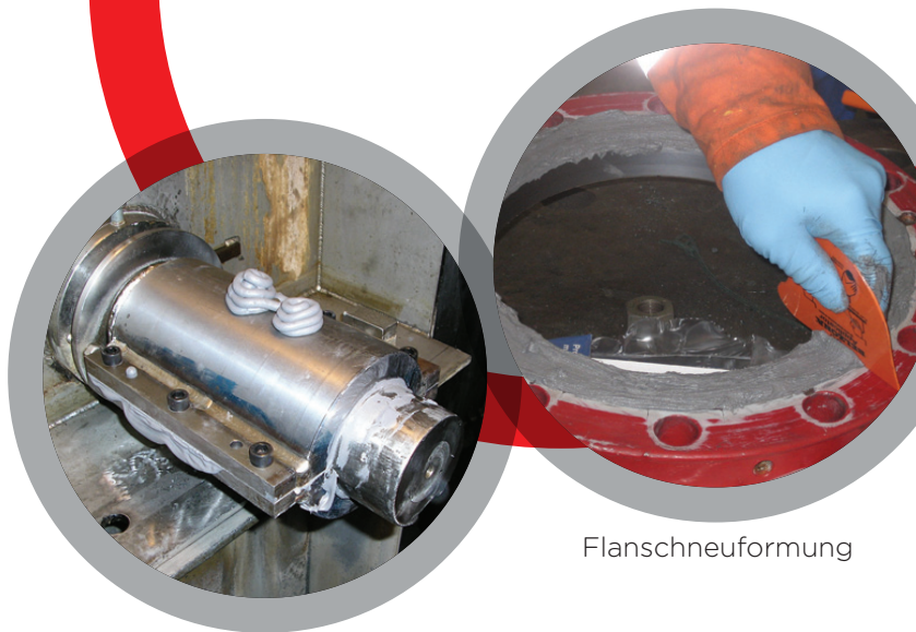
Aufbau von Lagersitzflächen vor Ort